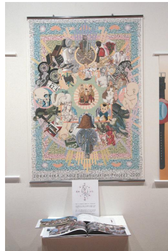
写真 3 移動に関する世界感を表現した曼荼羅