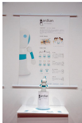
写真 5 学生作品 (Cardian)