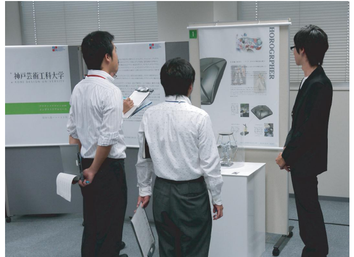
写真 2 東海理化本社でのプレゼンテーションの様子