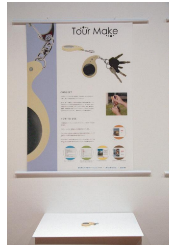
写真 4 学生作品 (Tour Make)