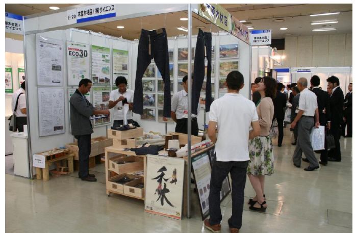
写真 3 ブース外観の様子