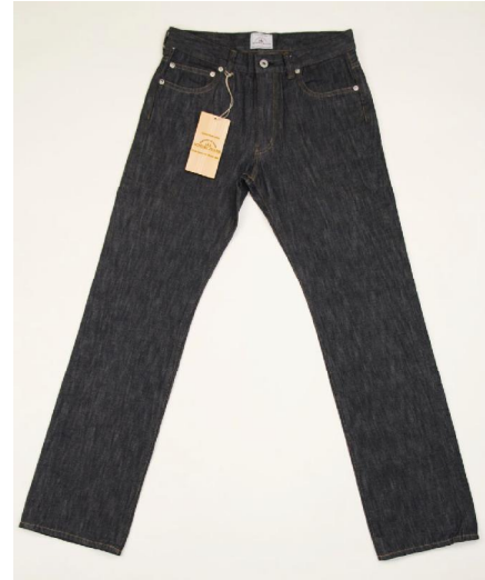
写真 1 ヒノキジーンズ