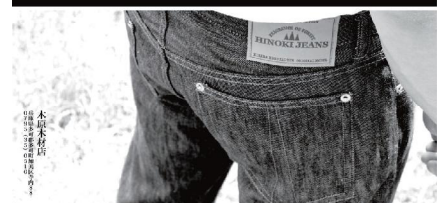
写真 2 ヒノキジーンズ紹介ポスター