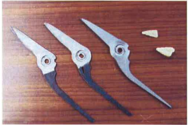
写真2 金型とロック部の検討

園芸用品 (Garden シリーズ) において、新商品「GardenOval」 (芽切りタイプ・剪定タイプ) を発売した。