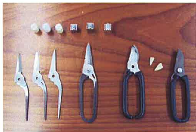
写真1 金型一次試作