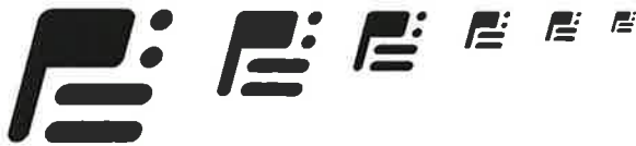
刻印ロゴコンセプト：市川町ロゴのイメージを踏襲しつつ、斜体にしスポーティなイメージを表現。