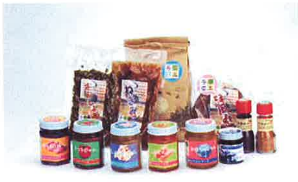
写真2 特産品ラベルデザイン