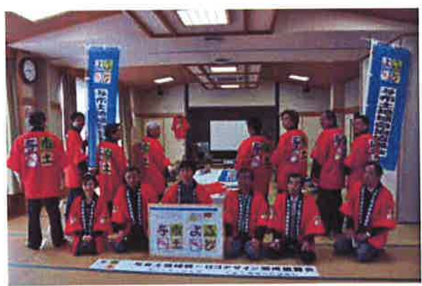
写真1 お披露目会にて

統一ロゴのデザインはじめ、10種あまりの各種特産品用ロゴの制作をおこなった。その成果を本学大学祭に於いて披露すると共に、各種HPへのリンクや、YouTubeサイトにアップし、与布土地域の知名度アップに努め、一定の成果を上げることができた。