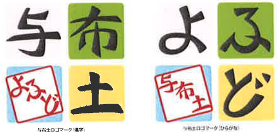
与布土シンボルマーク

与布土地域を代表する「しだれ穂・清波・水田・水田」の4つを色でイメージした。漢字書体とひらがな書体の2つを用いし用色によって使い分ける。全体は田の字型で構成されている。