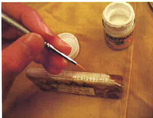
写真4：登録番号を記入する。

1.5 登録した資料に登録番号をエナメルで（水彩白色塗料）で記入する（写真4）。