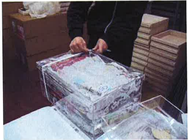
写真8：鑿を入れる木箱

6.2 資料を荷造りする。鑿の場合木箱を利用し（写真8）、10センチ以内の高さのものはアクリルケースで（写真9）、大きい道具はダンボールを利用する。