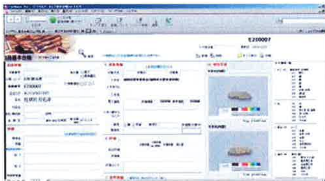
写真3：File Maker Pro.

資料のデータの管理ソフトウェアはFile Maker Pro.を使用する（写真3）。