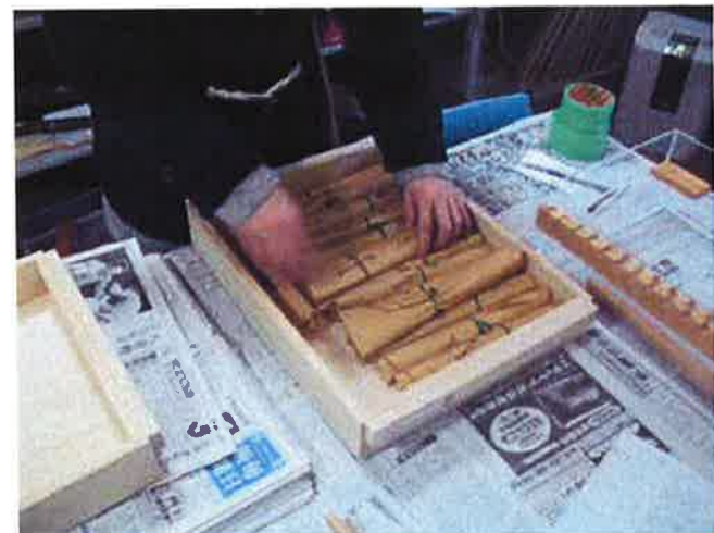
写真9：アクリルケースで荷造りする。