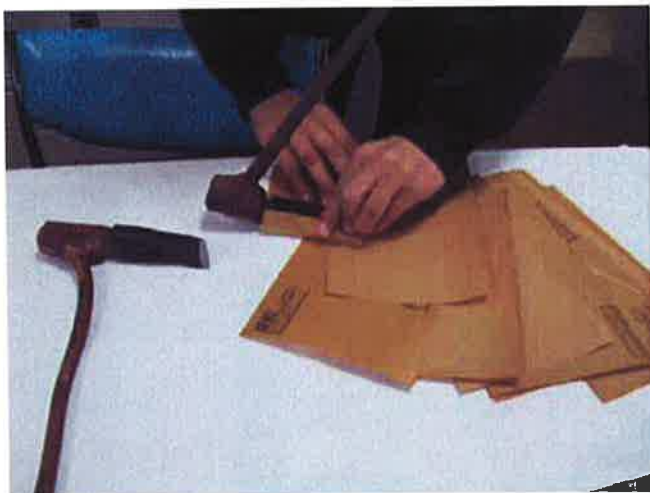
写真6：防錆紙で包む。

6.1 資料を梱包する。金属の場合、内側は防錆紙で包み（写真6）、木材の場合は薄紙で包む（写真7）。